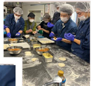
水高生 調理にも参加