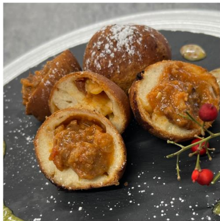
揚げピザ『加茂港の玉手箱』

加茂水産高校生が 実習で漁獲した 「アオリイカ」を トマトソースで美味 しく仕上げまし た。貝たくさん。 まるで玉手箱!!