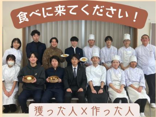
獲った人×作った人